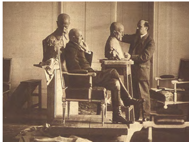
Ivan Meštrović portrétnující Tomáše G. Masaryka, Lány, 1923