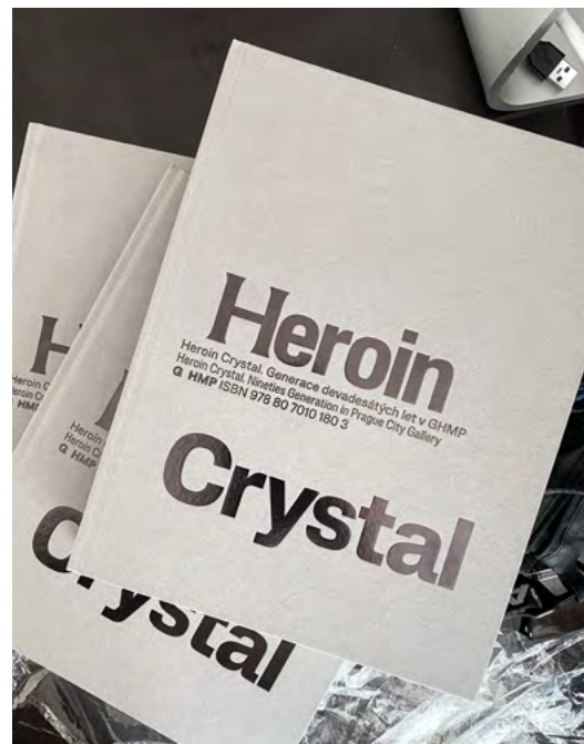
Obálka katalogu Heroin Crystal