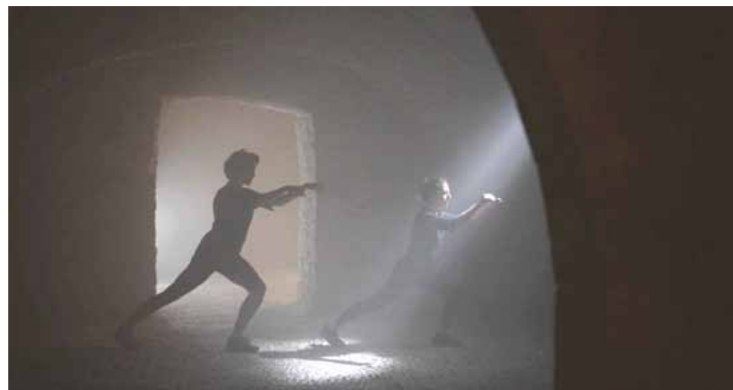
Záběry z videospotu / Film stills from the movie clip