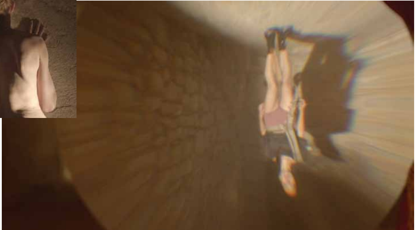
Záběry z videospotu / Film stills from the movie clip